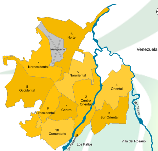
Ilustración 1. Area de Prestacion de Servicio

Cláusula 7. ÁREA DE PRESTACIÓN DEL SERVICIO (APS). El área en la cual se prestará la actividad de aprovechamiento en San Jose de Cúcuta .